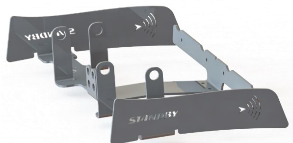
Halterung für Martinhörner (optional)